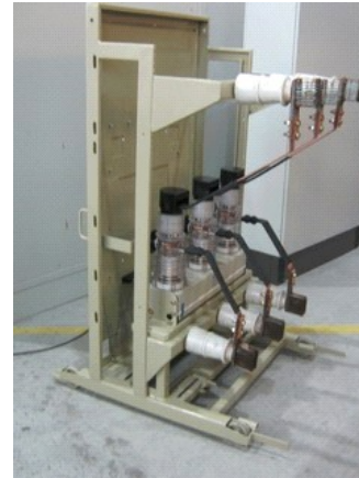
Restauration de cellules MT