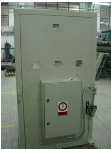
Restauration de cellule MT