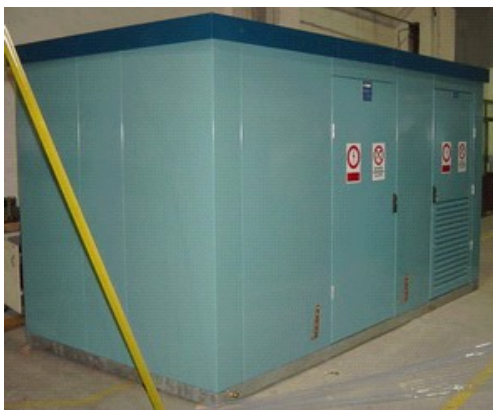
Roulement en aluminium pour poste MT